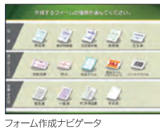
フォーム作成ナビゲータ